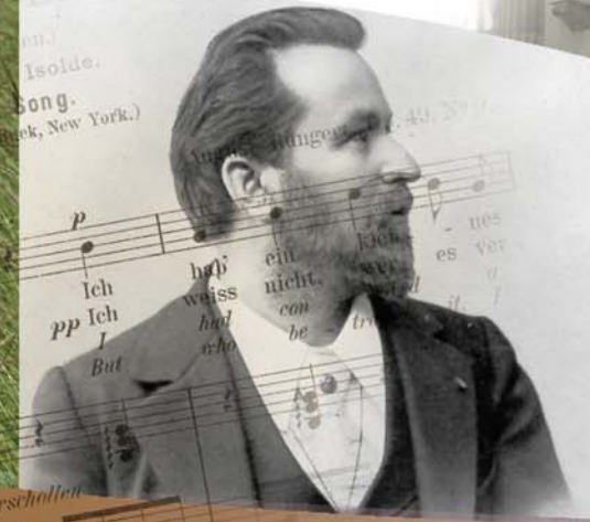
Komponist und Dichter (1845 - 1915)